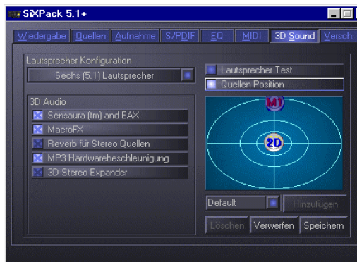
Mit Vorsicht zu genießen: Die 3D-Quellenpositionierung der SixPack

Dies alles trifft natürlich nur zu, wenn der Computer oder die DVD Surround-Daten liefert. Was ist nun, wenn ein Film oder ein Ton, der auf dem Computer abgespielt wird, nur in Stereo vorliegt, z.B. bei einer CD oder einem MP3 ? Viele Nutzer wundern sich, daß Stereosignale normalerweise nur auf dem vorderen Stereopaar einer Anlage abgespielt werden, wobei es doch eine Surround-Anlage ist. Dies ist damit begründet, daß die Anlage den unterstützenden Rückkanal im Sinne des Erfinders nicht blindlings dazu einsetzt, den Ton in Lautstärke, Ortung und Phasenlage zu verfälschen . Der Rückkanal sollte normalerweise entweder explizit durch ein Surroundsignal oder gar nicht angesprochen werden.